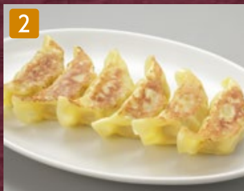
2 海老入り餃子(6個) 520円(税561円)