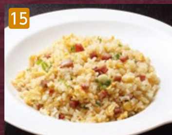
15 チャーシュー叉焼炒飯 780円(税842円)