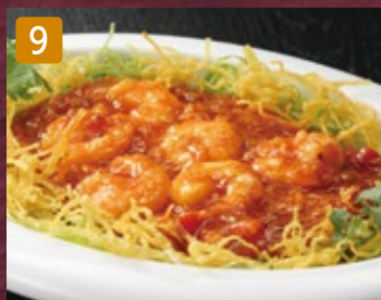
9 海老のチリソース煮XO醤仕立て 960円(税1,036円)