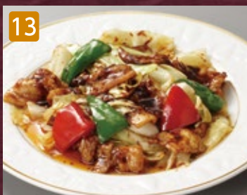
13 ホイコーロー回鍋肉 820円(税885円)