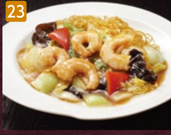
23 海老あんかけ焼きそば 1,080円(税1,166円)