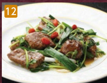
12 ニラレバXO醤炒め(国産牛レバー使用) 750円(税810円)