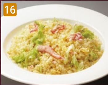
16 蟹レタス炒飯 880円(税950円)