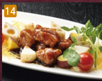
14 酢豚(豚肉と根菜のバルサミコソース) 920円(税993円)