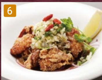
6 ユーリンチー油淋鶏 780円(税842円)