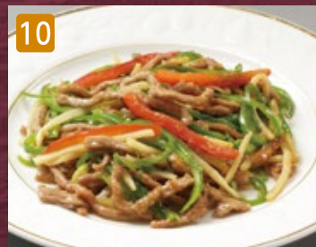
10 デンジャオニュールースー青椒牛肉絲 950円(税1,026円)