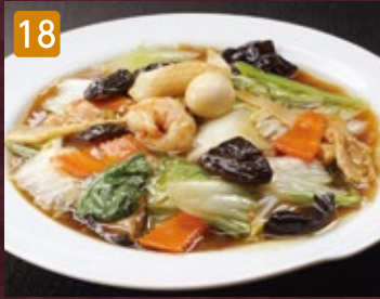
18 五目中華飯 960円(税1,036円)