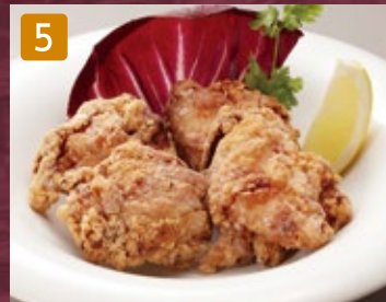
5 若鶏の唐揚げ 720円(税777円)