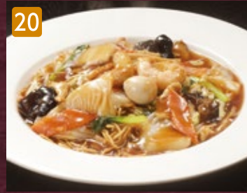
20 五目あんかけ焼きそば 960円(税1,036円)