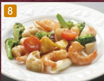
8 海老と根菜のオイスターソース炒め 860円(税928円)