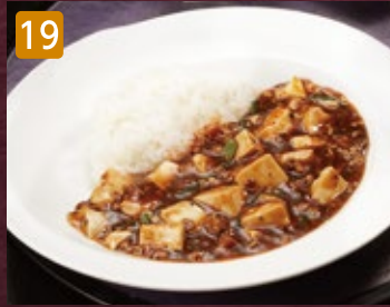
19 麻婆飯 880円(税950円)