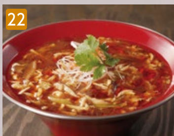
22 サンラータンメン酸辣湯麺 900円(税972円)