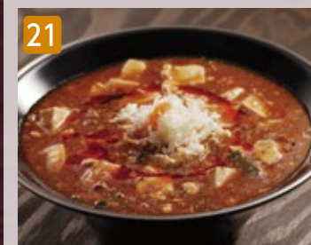
21 全とろ麻婆麺 900円(税972円)