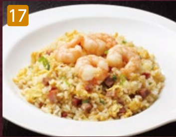
17 海老炒飯 980円(税1,058円)