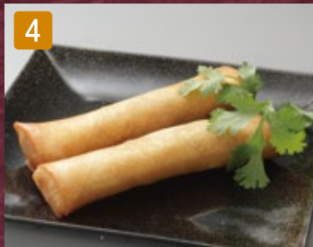
4 春巻き(2本) 440円(税475円) 春巻き(1本) 220円(税237円)