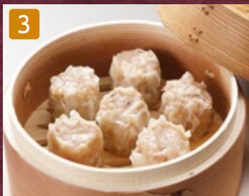
3 焼売(6個) 480円(税518円)