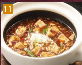
11 樓蘭特製 麻婆豆腐 800円(税864円)