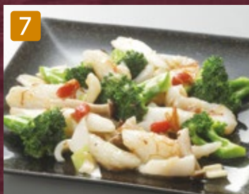
7 ヤリイカとブロッコリーのXO醤炒め 850円(税918円)